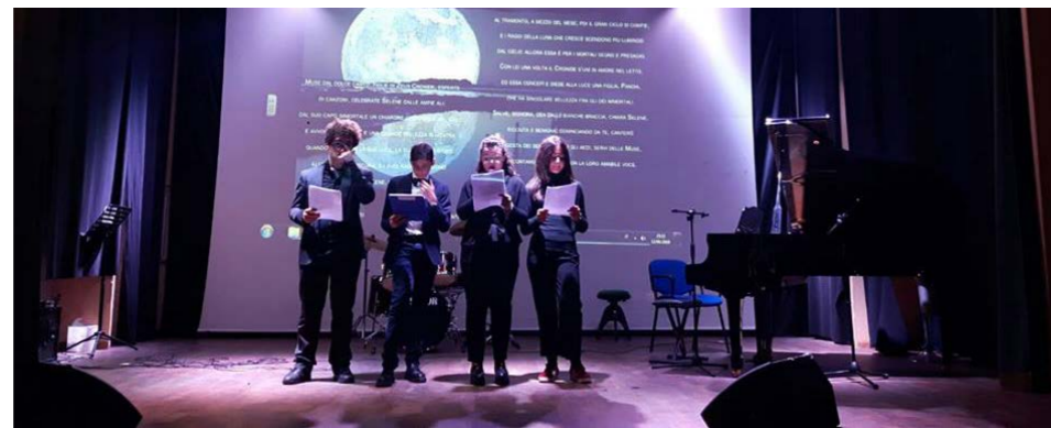
Notte Nazionale del Liceo Classico

Dal 2018 l'indirizzo si attiva solo al raggiungimento del numero minimo di iscritti e garantisce lo stesso monte ore del piano di studi ordinamentale ma distribuito in quattro anni con l'ausilio delle compresenze. Il momento della compresenza si propone di lavorare sull'integrazione dei curricula fra loro, non solo da un punto di vista dei contenuti, ma soprattutto del metodo. La metodologia laboratoriale consentirà ai docenti di lavorare per piccoli gruppi, alleggerirà il lavoro domestico e avrà come punto di forza la trasversalità di tutte le discipline.